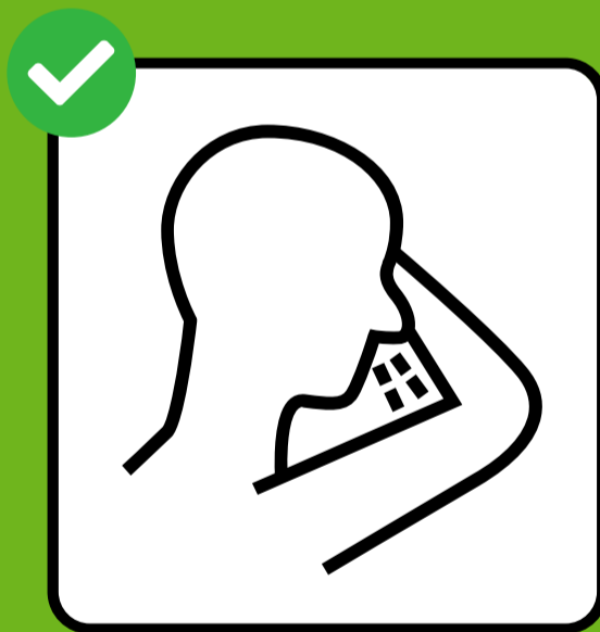
Ku qufaca iyo ku hindhis istiraasho ama qalooqa garabkaaga.