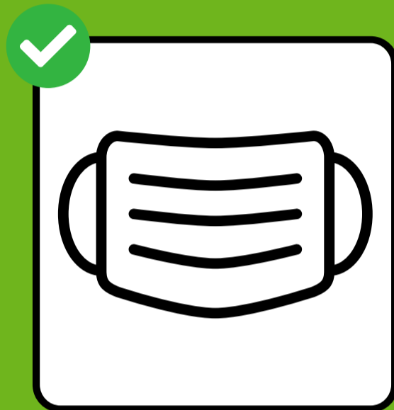
Xiro maaskaraha wajiga.