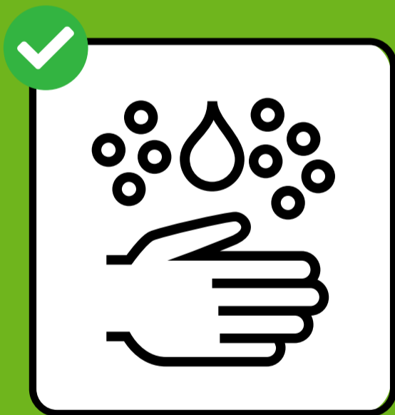
Dhaq ama jeermisdil gacmahaaga oo dhan.