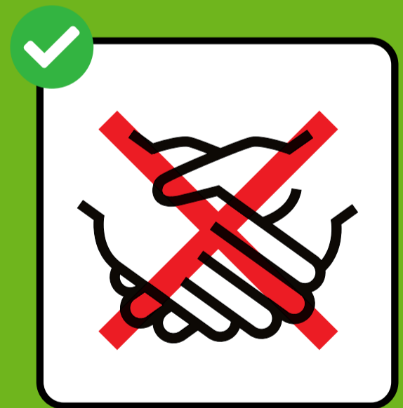
Ka fogow gacmo ka salaamida.