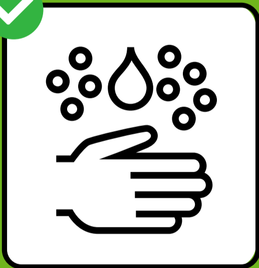
ལག་པ་དབྱིས་བྱིན་པ་ལྷུས་བའམ་ ཕ་མེན་དག་ཚས་བྱུགས།