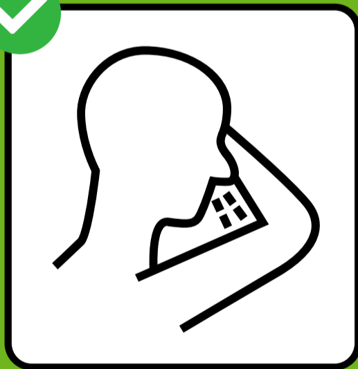
སློ་དང་ཉལ་སྤྱིད་སྐབས་བྱིས་ནང་ངམ་ གྲུ་མོའི་ལྷག་ཏུ་བྱོབས།