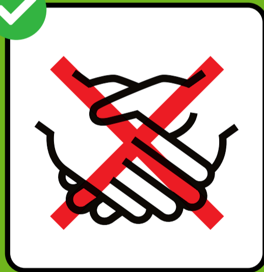
ལག་པ་གཏོང་རེས་སློངས།